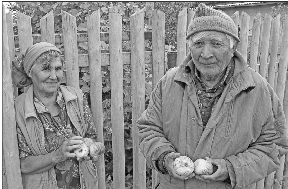
Юлийапа Юрий Сумбаевсем.

Юлиа Александровна каланә тәрәх – 1965 сұлта «ШуҶам» совхоз йышне кәрсөн ял йәшма пусланә. Ҷынсем цивилизация сывәхарах пулма хушәшләнә ахәртнөх: пәрисем Энтри Пасарне қусса кайнә,