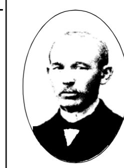
"ХЫПАР" никӑслевӑи Н.В.Никольский (1878-1961)