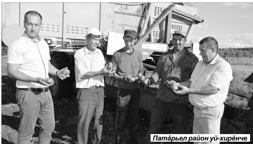
Сәйүкерҗөкө www.sar.ru сайтран илнө

Хуҗалықсенче утә – 138,7, сенаж – 129,4, силос 18,6 процент хатөрленө. Условнәй выльах пуснө республикөпе 19,4 апат единици тивөт.