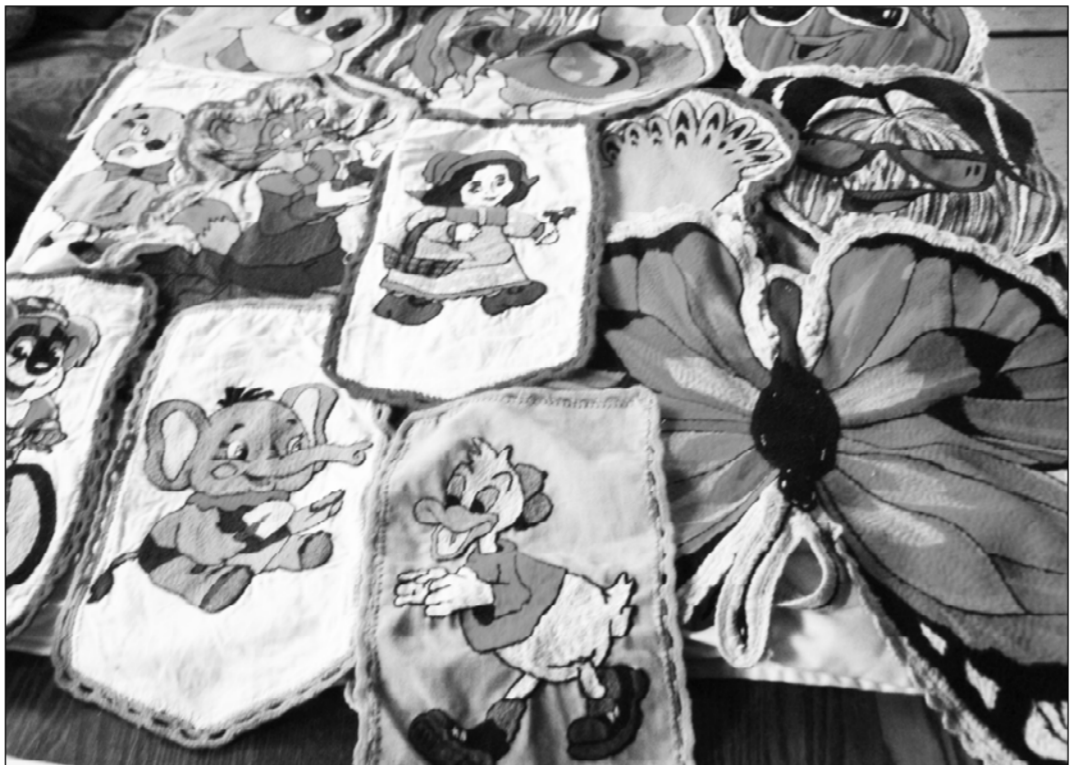
• Эрхип тересен ерссем.

Паян республикари кашни ялта урсу-хусах пайтах. Пери авланма иртерех тесе самраклх иртине сисе юлайман, тепри – тура сырни пусма вешнех киле-ха тесе кетне, виссемеше – ашше-амашне тивестерекен хер тупайман. Ман шухашпа, тепер пелтерешле салтав та пур. Ялти хаш-пер качча именчек, шалти туйамне усма ватанат. Херсем ытларах чухне хяоллисене килештересце. Варттанла мар, самраклхерсене хула пурнасселерет. Ашше-амашше те пичекрен: «Хамар тертленни те сител, эсир хула канлел пурнаар», – тефс мар-и? Терессипе, хаше-пери телперчкесене куесене хупиченех аш сунат айенче усрама хатер.