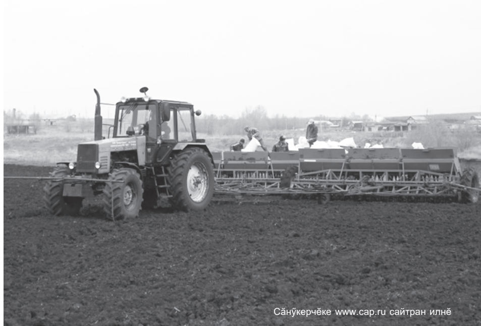
Сәнүкерчөкө www.cap.ru сайтран илнө