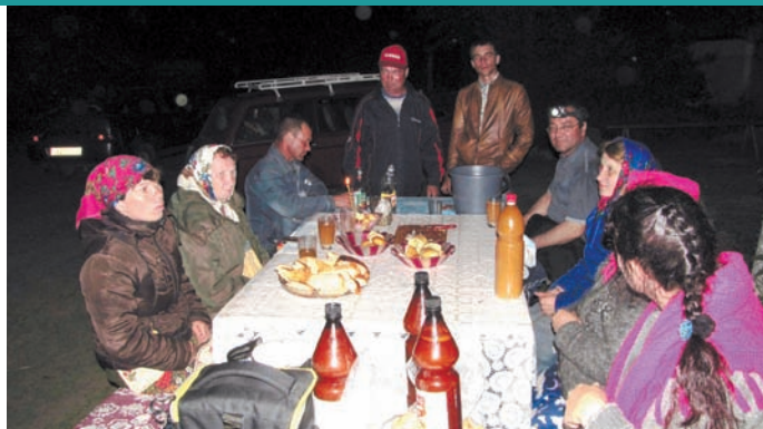
Хирлеп хёрринчен тавра́нсан

Чәнка́ сыранран анса яраҗсё кимме, каялла вара савра́нса пахмасар чупмалла. Палла ёнтё, ватә хёра́рәмсем ку йәлана хутша́нман. Мешехе тыта́мне тимлесен, сёрлехи сыран хёрринче тем те пулма пултарна́. Ун чухне кәмәл-сипет чылай чух сүт